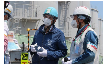
IAEA的格羅西總幹事 (Rafael Mariano Grossi) 視察ALPS處理水相關設備 (2022年5月)