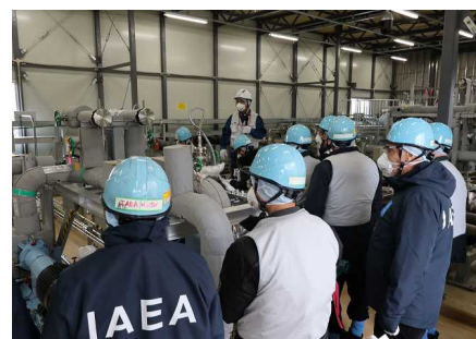
视察输送设备的特别工作组（2024年12月11日，福岛第一核电站）

※1 IAEA特别工作组当中，有6名IAEA职员和9名国际专家来访日本 (国际专家：阿根廷、英国、加拿大、韩国、中国、法国、美国、越南、俄罗斯)