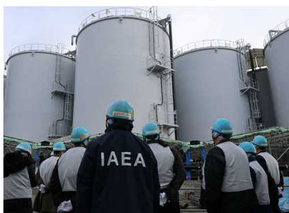
视察测量、确认专用设备的特别工作组 (2024年12月11日，福岛第一核电站)