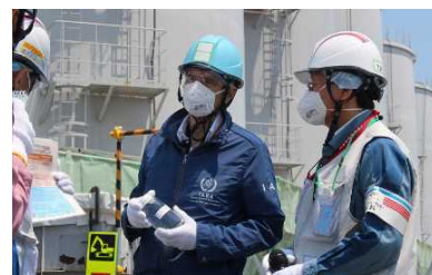
IAEA总干事格罗西（Rafael Mariano Grossi）视察ALPS处理水相关设备（2022年5月）