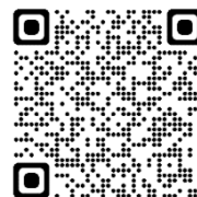
综合报告（左）和原文链接（右）