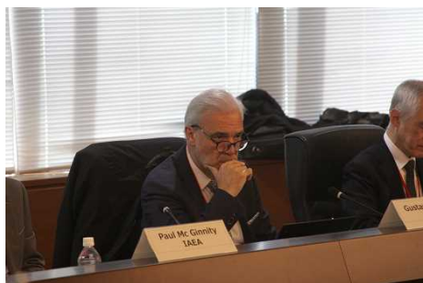
在评价和审查任务开幕式上的IAEA卡鲁索协调官 (2024年12月9日 外务省)