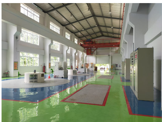
Air Putih 発電所