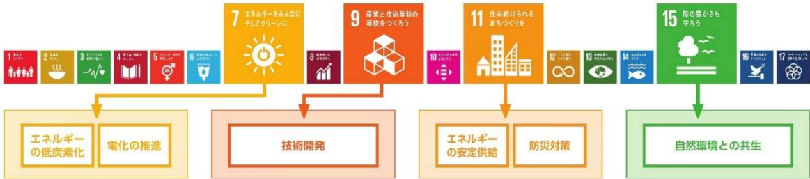
図 東京電力グループのSDGsへの取組み

* SDGsとの関連性は、グリーンボンド原則を定めるICMAが公開しているGreen, Social and Sustainability Bonds: A High-Level Mapping to the Sustainable Development Goalsを参照した、グリーンボンド発行に際して補完的なものであり、直接的に資金調達目的として関連付けるものではありません。