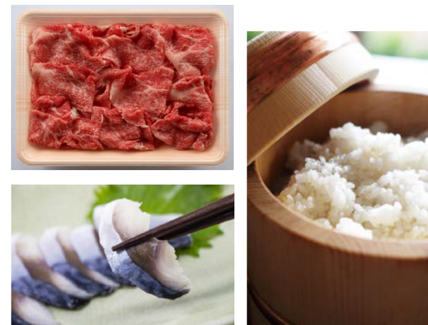
【イメージ】プレゼント商品