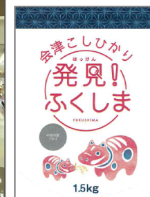
【イメージ】小売店での販売促進イベント・ライブキッチン・発見！ふくしまパッケージ