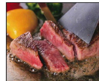
【イメージ】福島牛フェアの料理