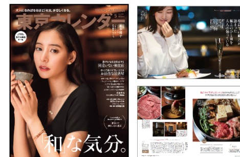
【イメージ】東京カレンダー記事掲載