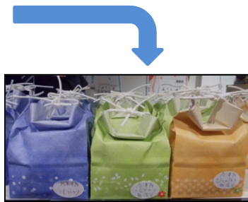
<企業内マルシェの様子>