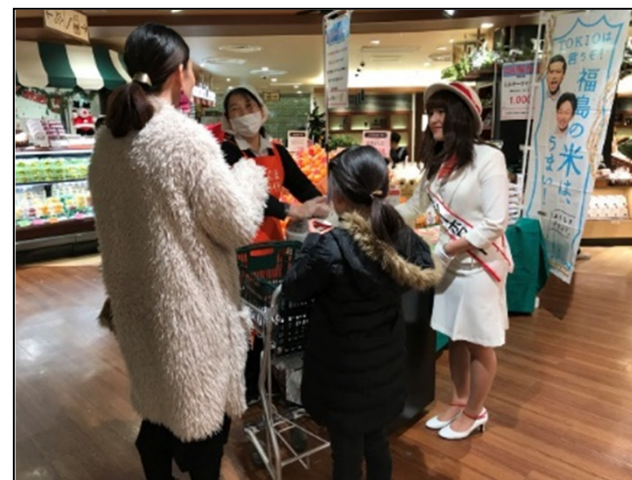
<首都圏でのイベント開催・支援>