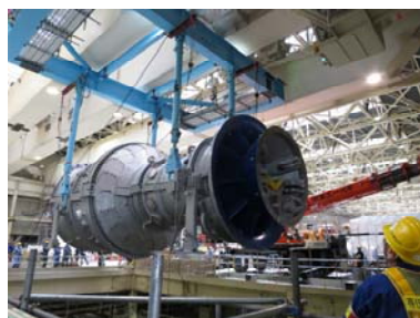
新しいガスタービン設備本体の吊り上げ作業