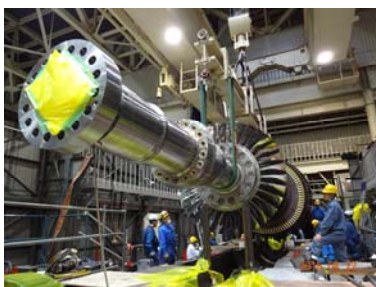
新しいガスタービン設備(ローター)の吊り込み作業