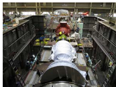
ガスタービン設備分解作業