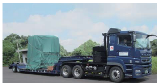
大型機器のトレーラー輸送