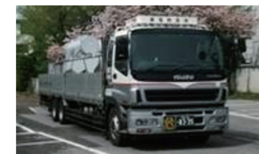
配電用品のトラック輸送