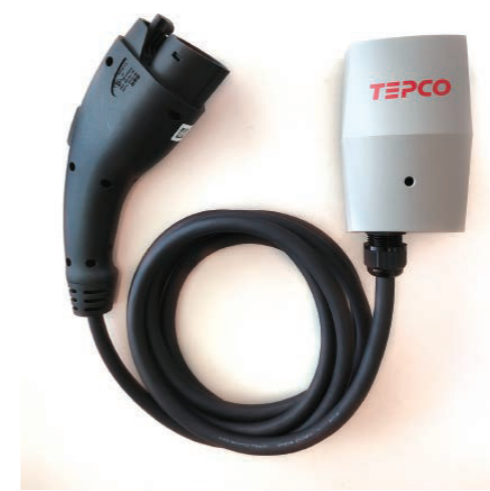
充電器(ケーブルコネクタ)

質量：約1.2kg 寸法：128×80×85mm(突起部ケーブル含まず) ケーブル長：標準4m(オーダー可能) 最大充電出力：3.2kW