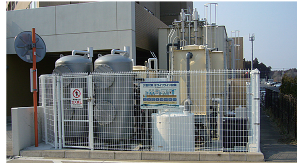
地下水飲料化システムの設置事例