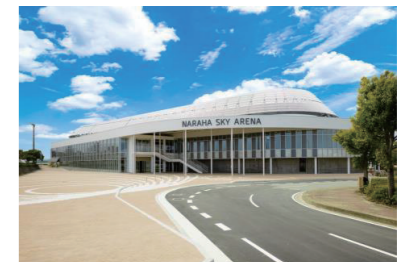
ならはスカイアリーナ