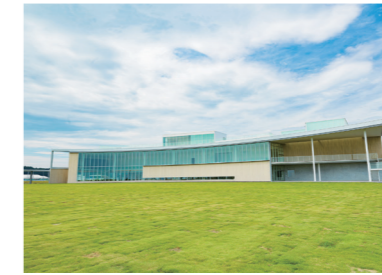
東日本大震災・原子力災害伝承館