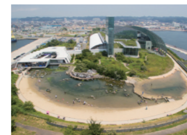
ふくしま海洋科学館