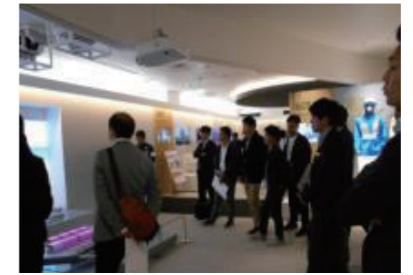
東京電力廃炉資料館