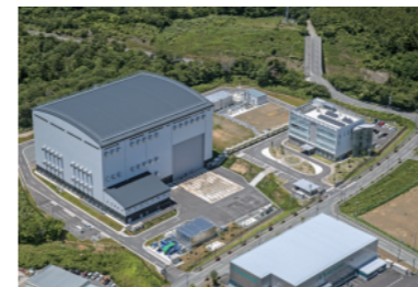
JERA 榴葉遠隔技術開発センター