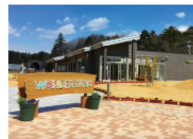
ワンダーファーム