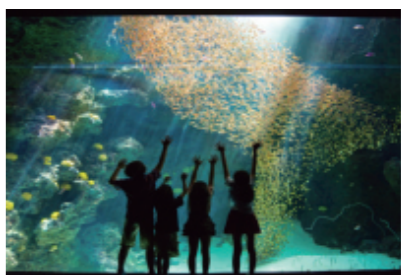
アクアマリンふくしま