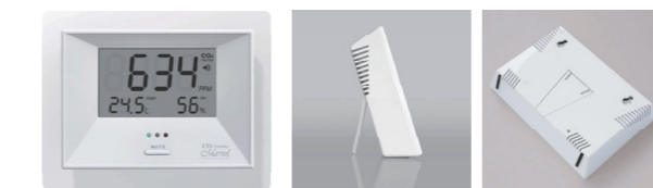
■マーベル001 メーカー希望価格 20,000円(税込22,000円)