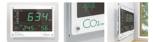
■マーベル301 メーカー希望価格 170,000円(税込187,000円)

上記、標準仕様に加えて、計測したCO 2 濃度・温度・湿度のデータの記録・分析を可能にしたデータロガー内蔵モデル。 (時刻設定・データ編集用の専用ソフトウェア付き。対応OS windowsのみ)