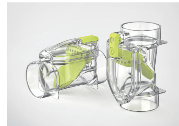
エアカットバルブオールクリア