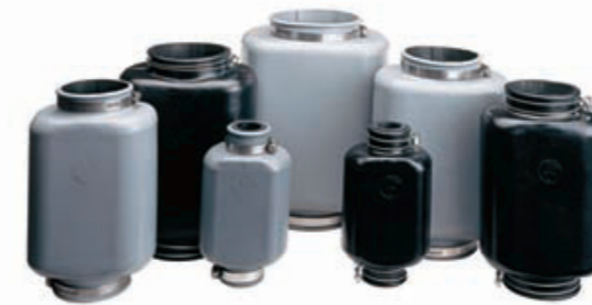
ゴム製エアカットバルブ