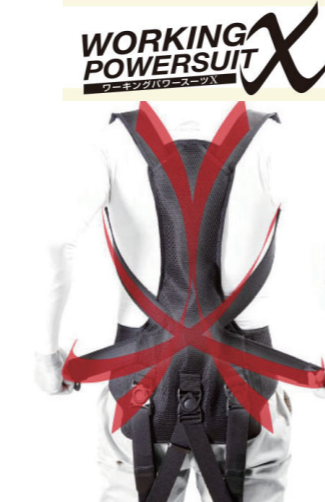
ワーキングパワースーツ X M/L/M(TALL)/L(TALL)