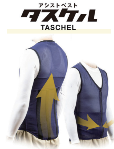
アシストベスト タスケル SS/S/M/L/LL/3L