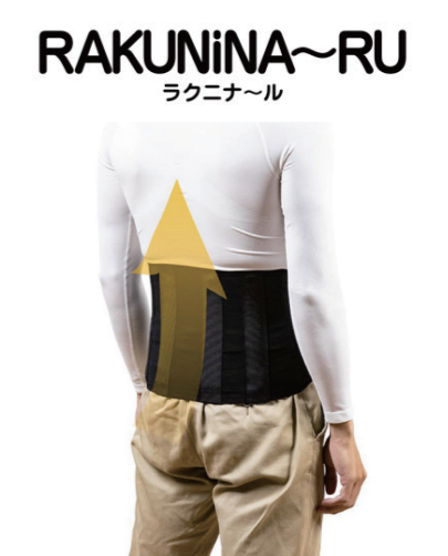
アシストベルト ラクニナ〜ル S/M/L/LL/3L

※東京パワーテクノロジー(株)は、(有)アトリエケーが製造販売するワーキングパワースーツX、アシストベストタスケル、アシストベルトラクニナ〜ルの正規取扱店です。