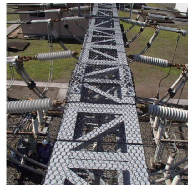
変電所ガントリーの営巣対策「防鳥ネット」