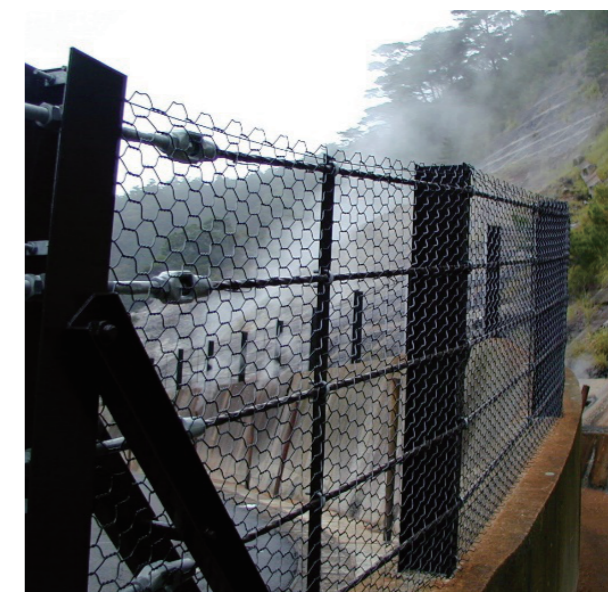
火山性ガス発生地帯の落石防止柵「ストーンガード」

※日本フィールド・エンジニアリング(株)はSTKネット工法研究会正規会員：(株)富士電子産業の販売代理店です。