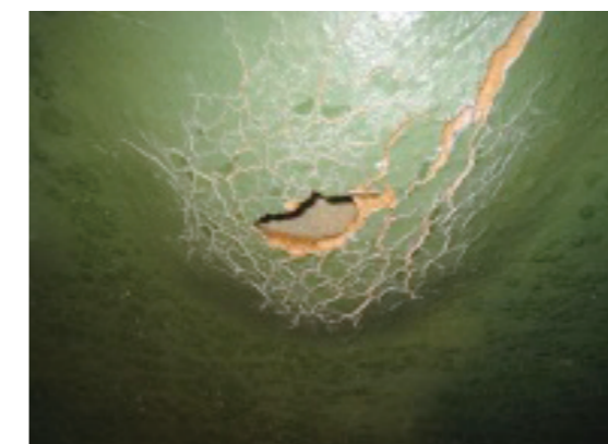
①既設断熱防水の不具合(浮き、破損)