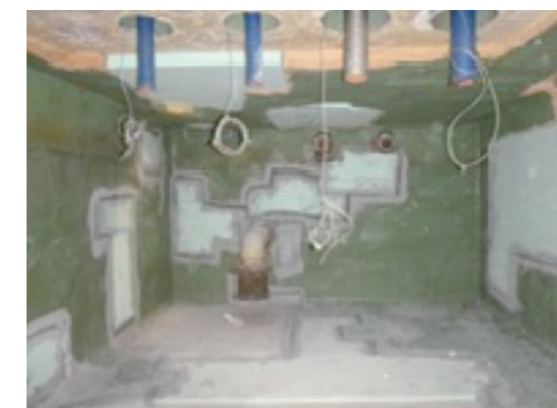
③断熱の部分補修箇所