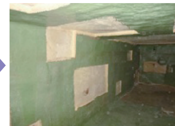
②既設断熱防水の部分撤去