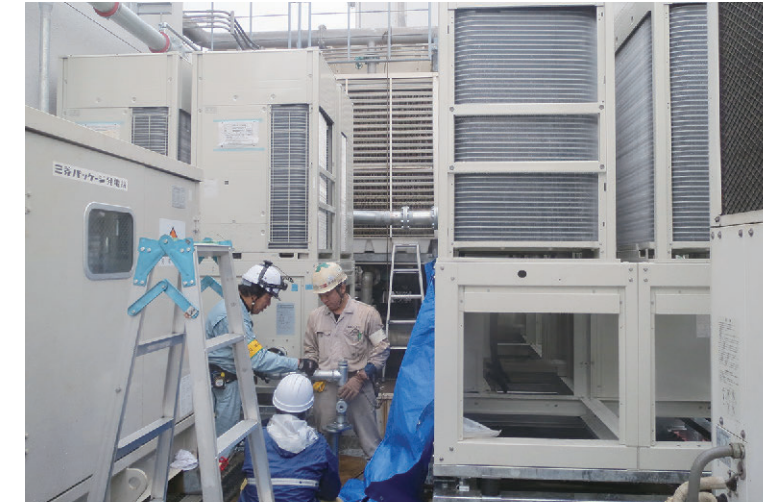
機器据付作業の様子