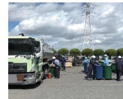
タンクローリーによる注油作業