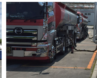
タンクローリーへの積込作業