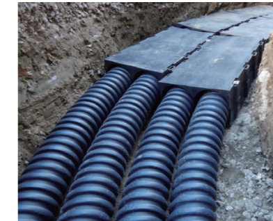
FEP管による配管工事