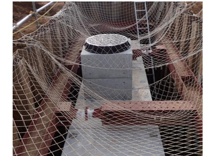
マンホール設置工事