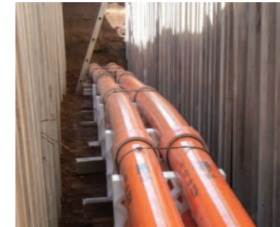
PFP管による配管工事