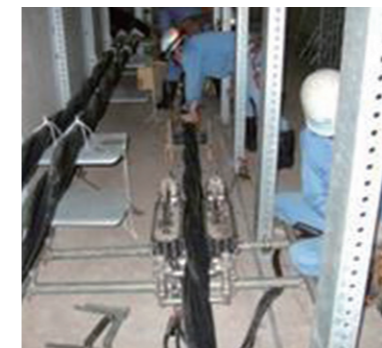
地中ケーブル新設工事