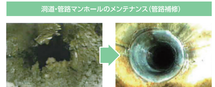
洞道・管路マンホールのメンテナンス(管路補修)