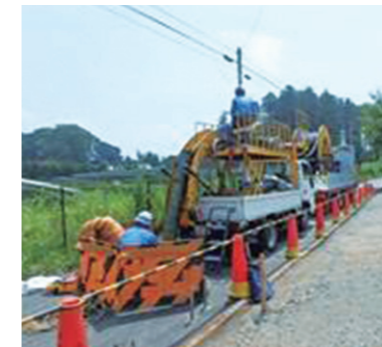
地中ケーブル新設工事