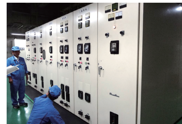
受変電設備年次点検