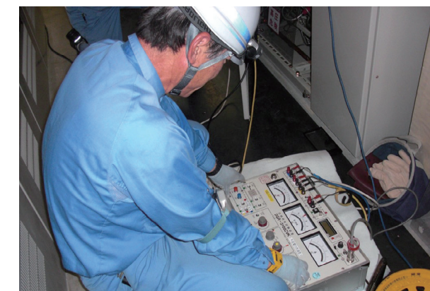
受変電設備リレー試験