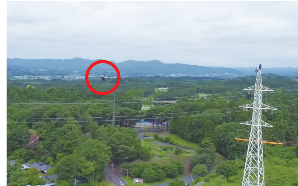
ドローンを活用した 工事・保守の様子