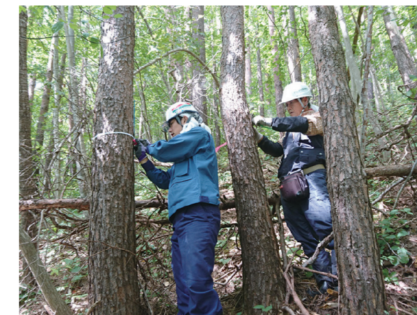
自然環境調査（森林調査）