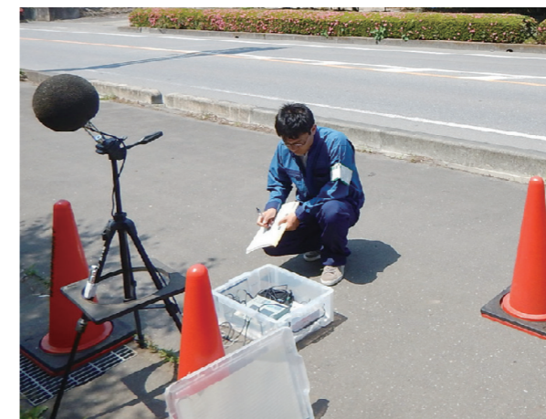
生活環境調査（騒音・振動測定）