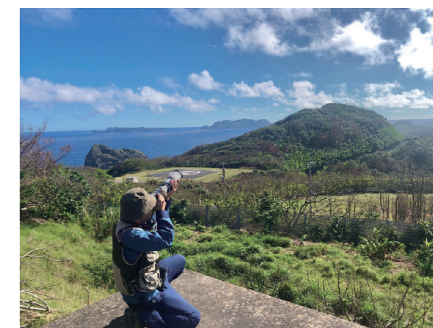
自然環境調査（動物・植物調査）