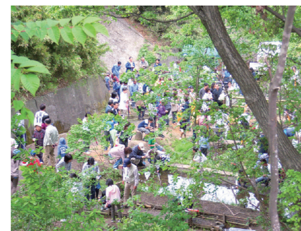
環境保全再生活動（ホテル生育場再生と放流会）