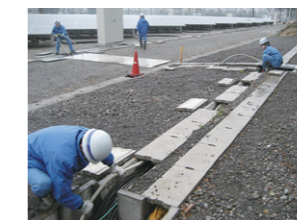
各種工事および修繕