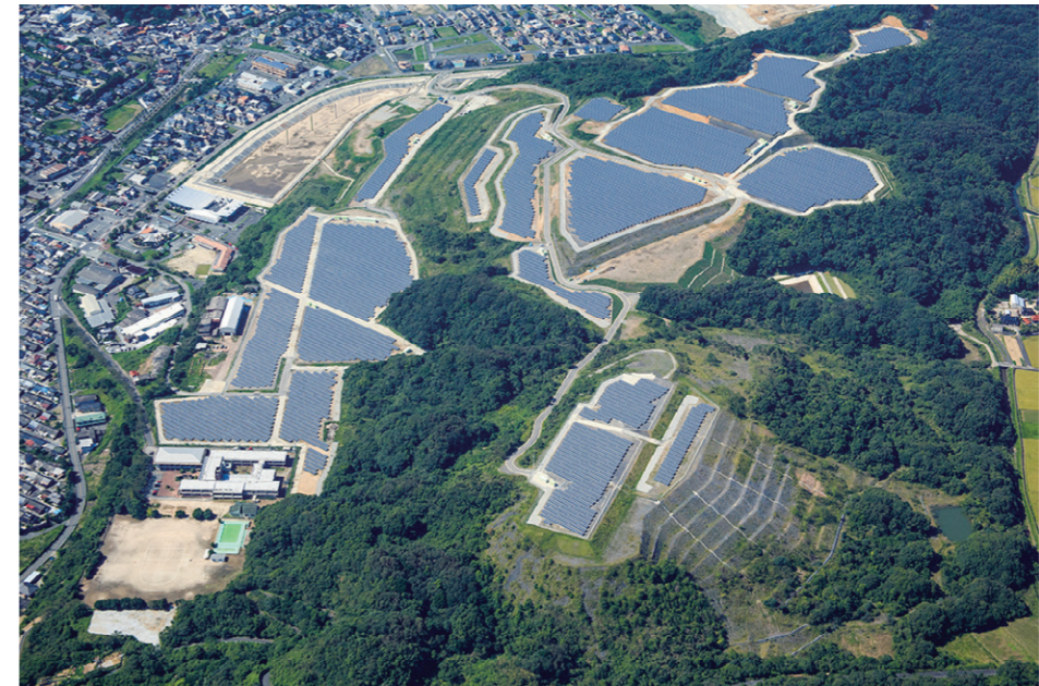
受託している大規模太陽光発電所の事例：福岡県 K 太陽光発電所