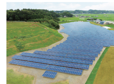
メガソーラー発電所建設