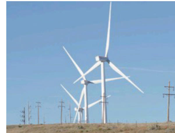
風力発電事業用地取得