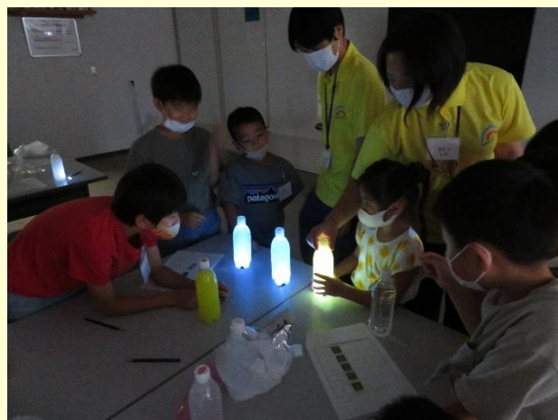
自由研究で光の実験をしました