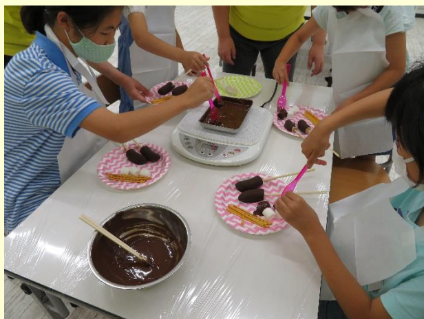
電化製品のお勉強のあとにチョコフォンデュ。 おいしい実験です。