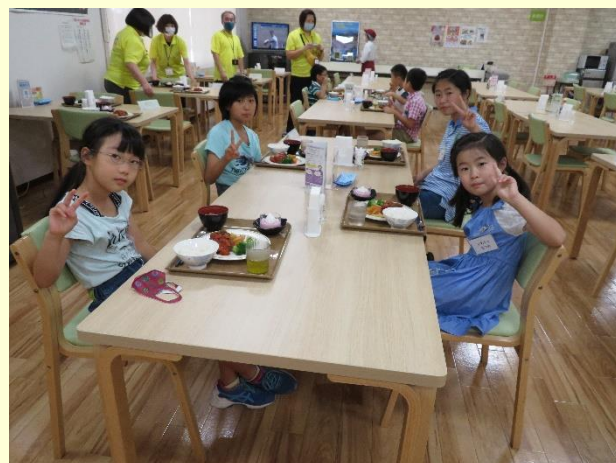
ハンバーグとイチゴプリンをもりもり食べました。 ソーシャルディスタンスでランチです。