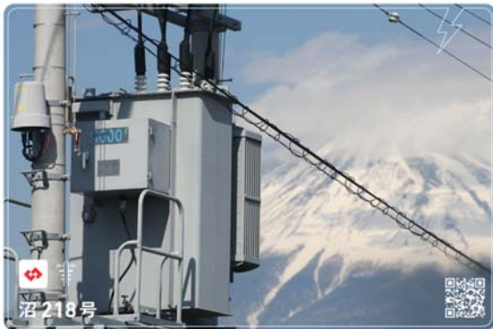
図3 電柱 NFT カード (沼 218 号)