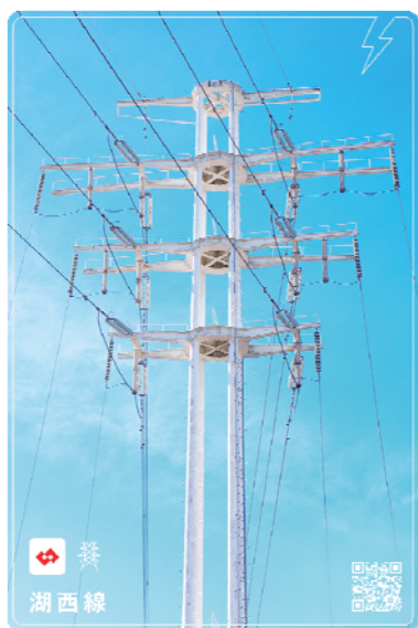
図1 鉄塔 NFT カード（湖西線）