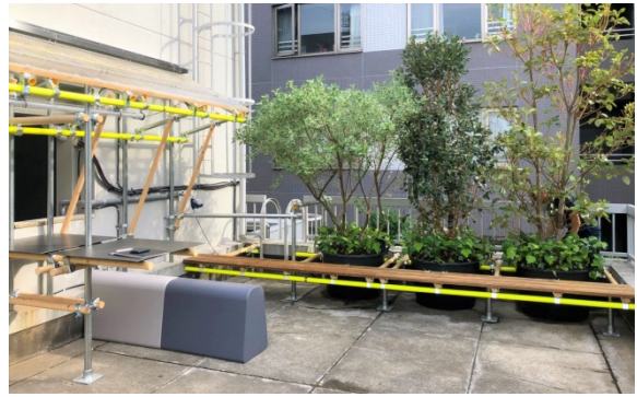
<施工後>共用テラススペース