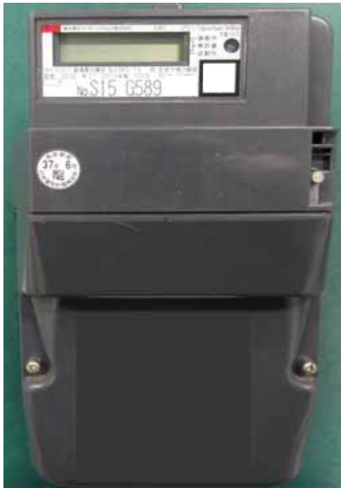
故障が発生したスマートメーターの外観 (外観上の異常は見られない)