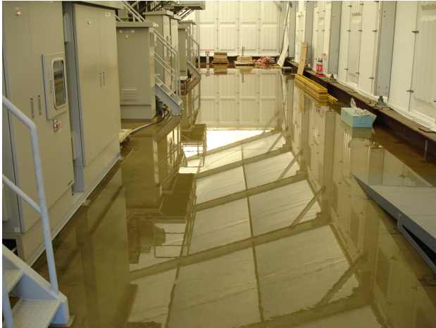
蒸発濃縮装置(建屋内)