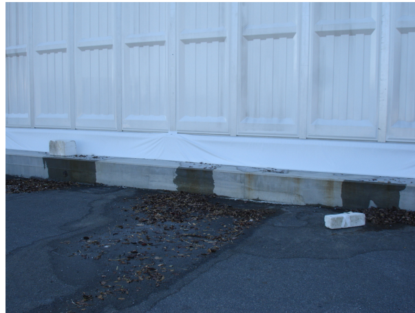
漏えい箇所の様子(その2)