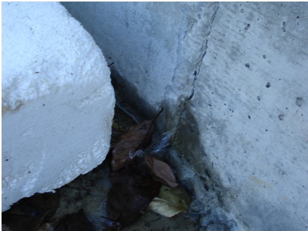
漏えい箇所の様子(その1)