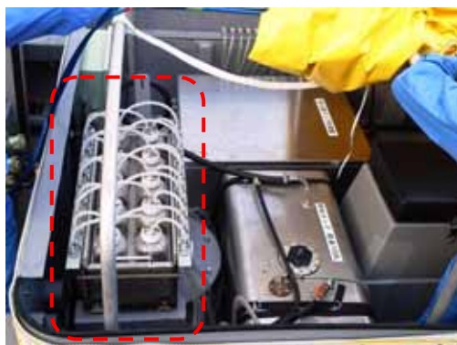
< 採水器（赤点線内） >