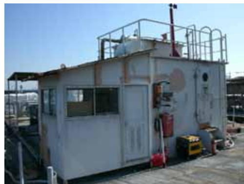
< 操作小屋 >