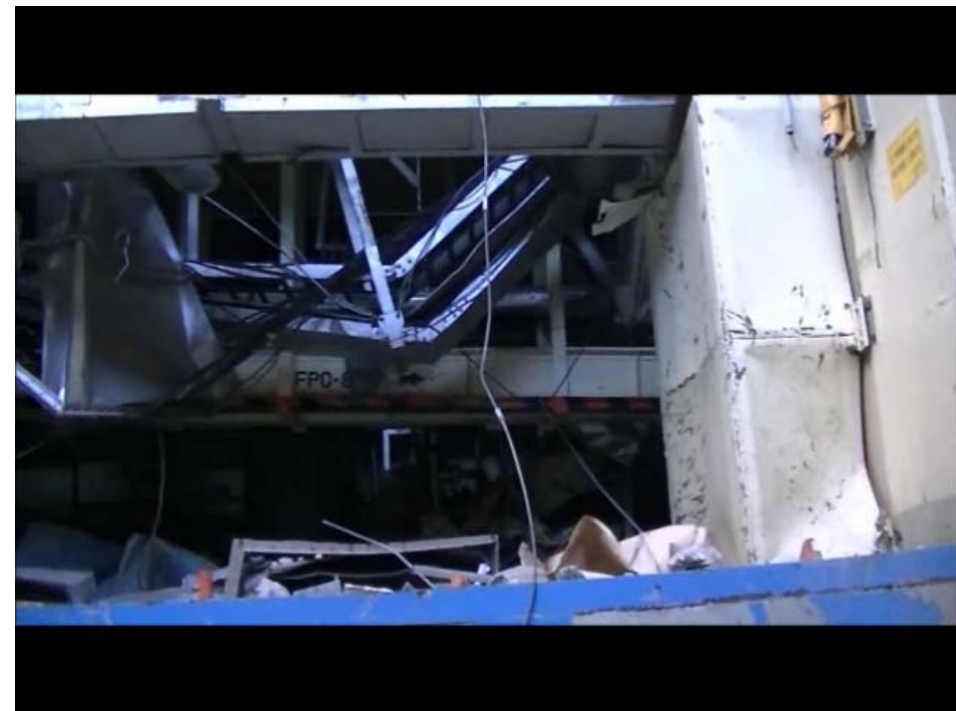
撮 影：東京電力株式会社 撮影日：平成23年10月12日