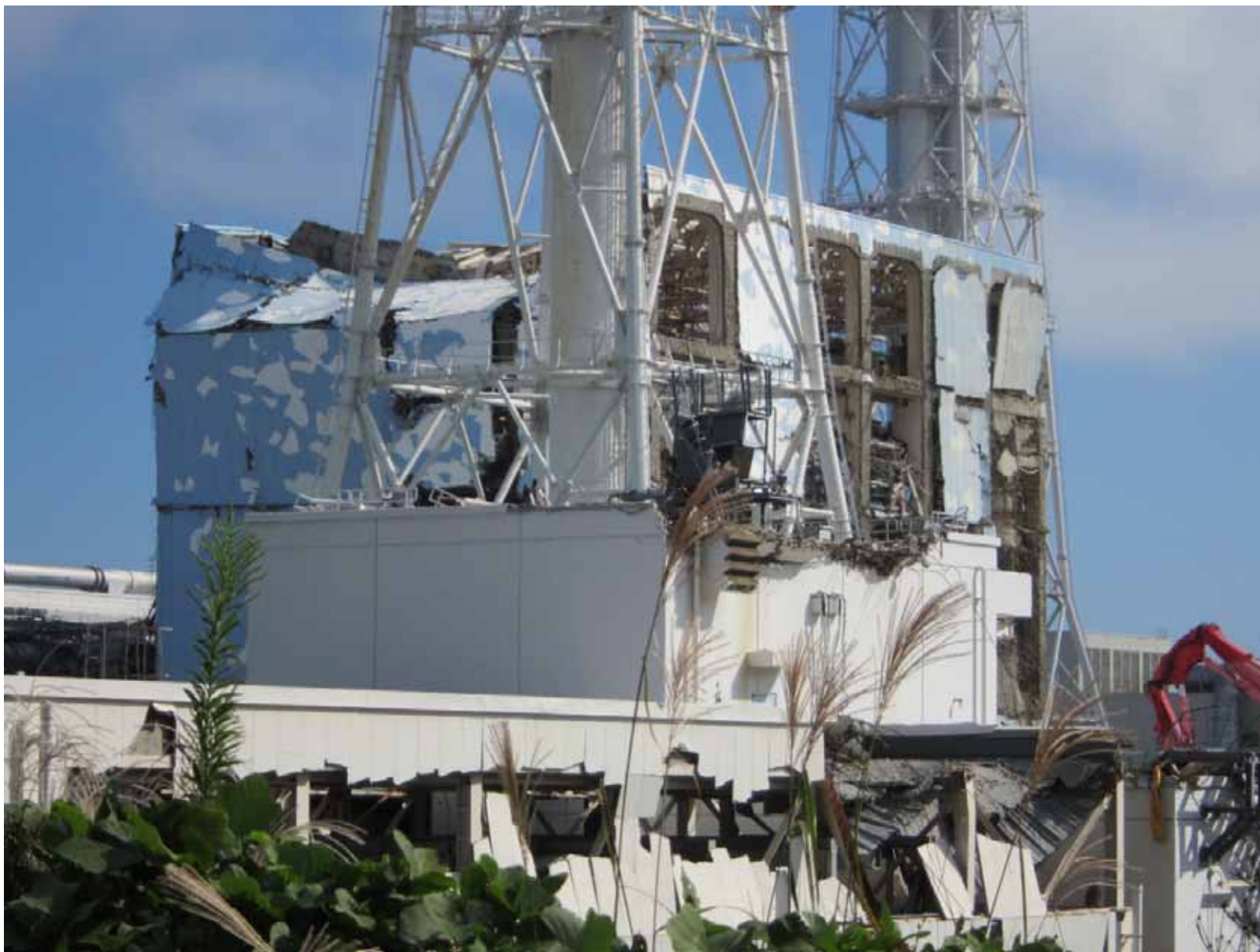
4号機原子炉建屋外観 ～ 2・3号機間西側高台から撮影～ 平成23年9月29日