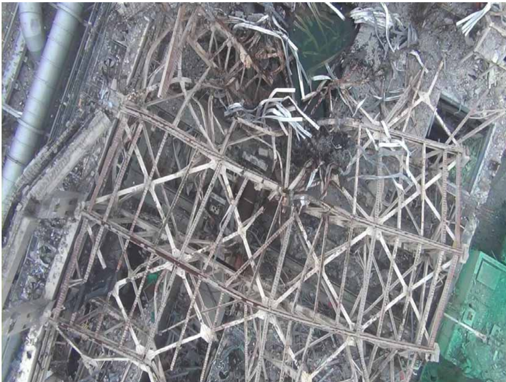
3号機原子炉建屋外観 ~クレーン上空から撮影~ 平成23年9月24日