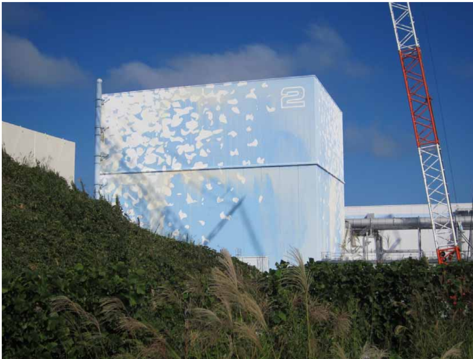
2号機原子炉建屋外観 ～ 2・3号機間西側高台から撮影～ 平成23年9月29日