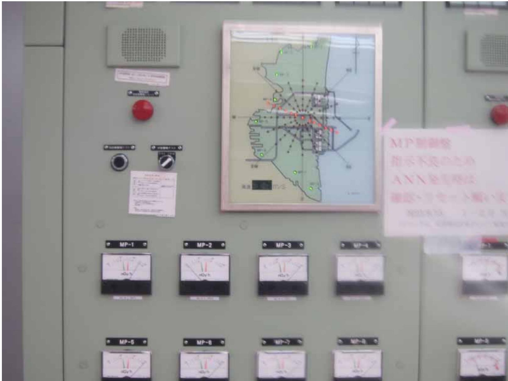
屋外放射線監視盤（モニタリングポスト） ～ 1・2号機中央制御室～ 平成23年9月22日