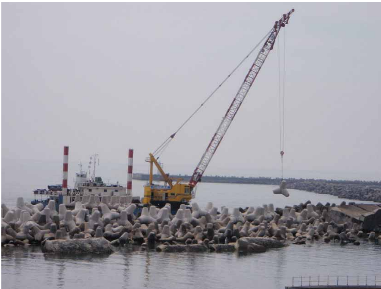
5・6号機防波堤（作業風景） 平成23年6月8日