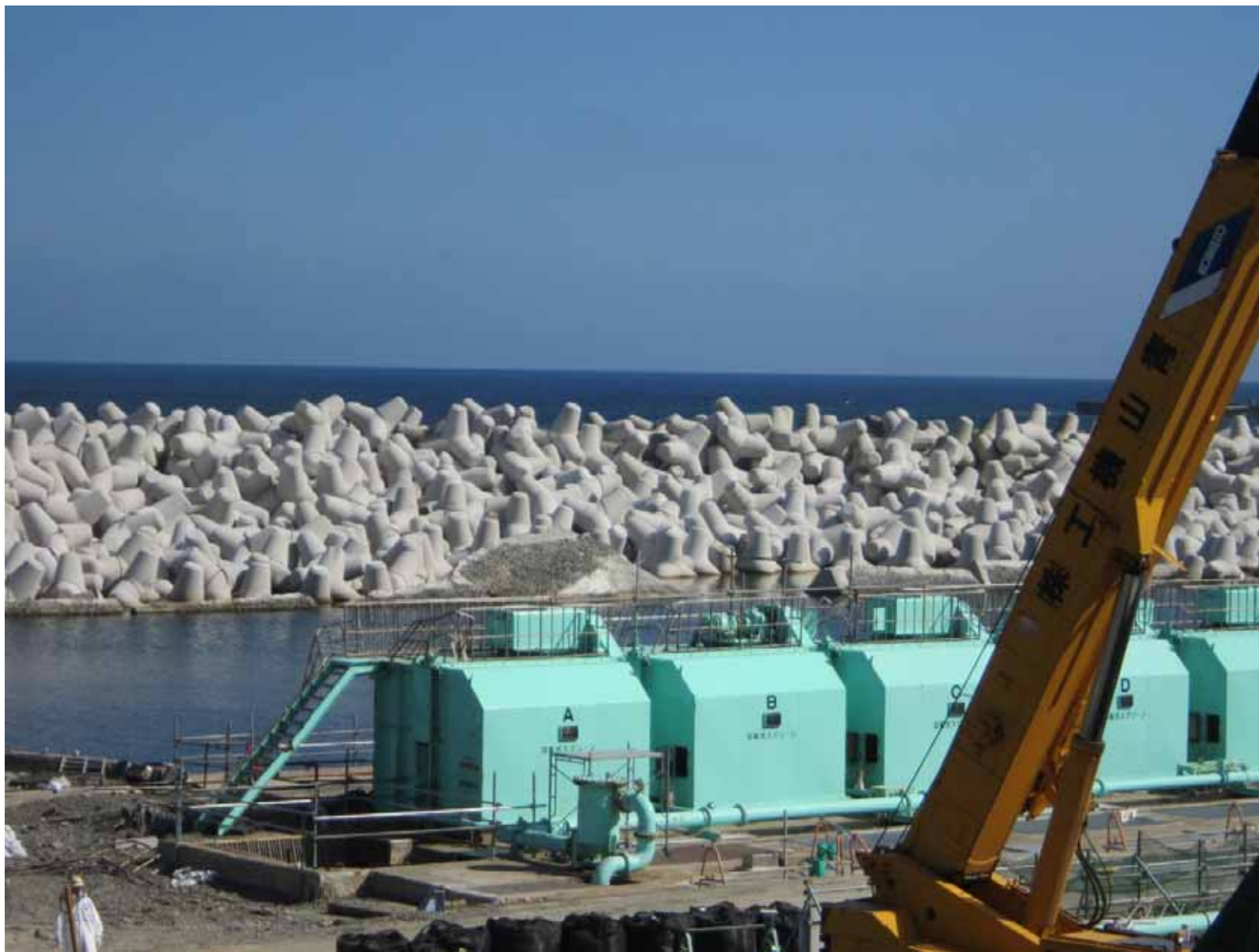
5・6号機防波堤 平成23年9月29日