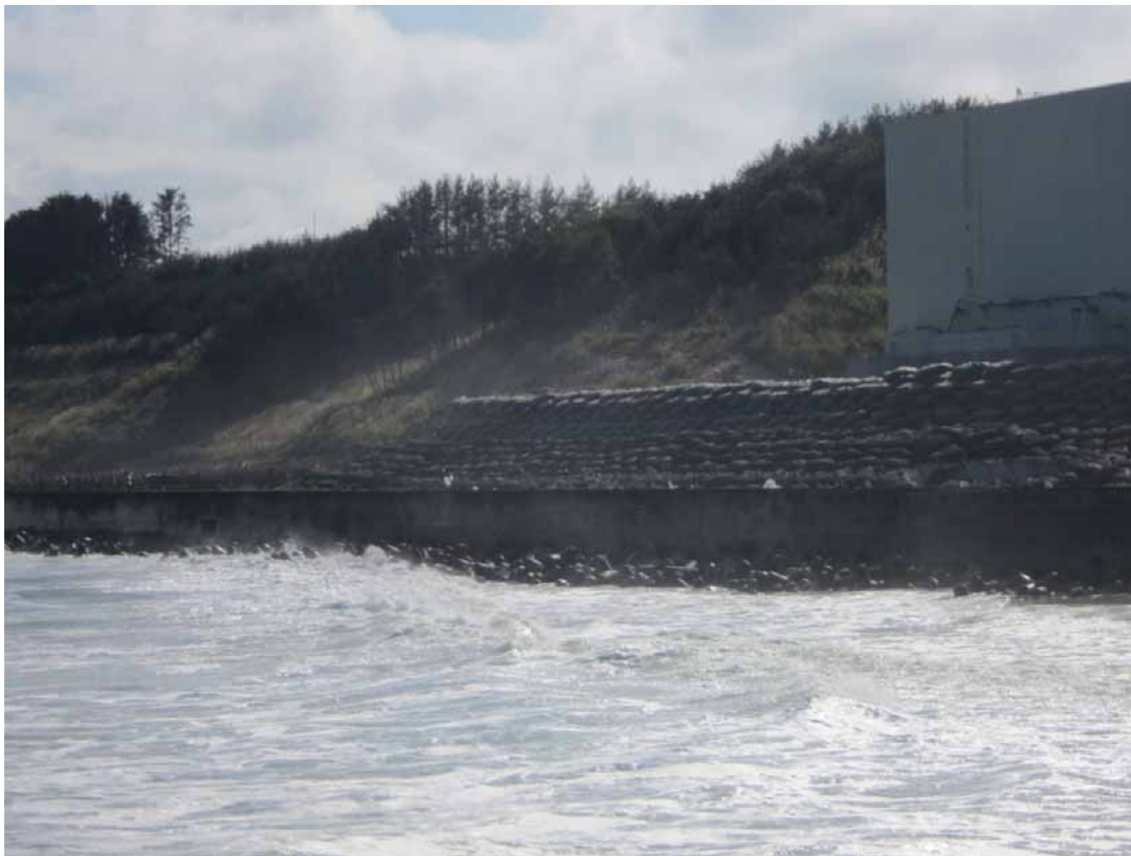
防潮堤 ~海側から~ 平成23年9月29日