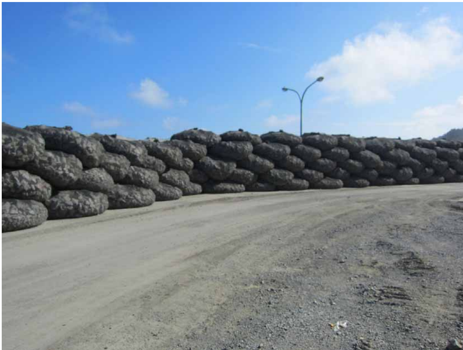
防潮堤 ~陸側から~ 平成23年 9月29日