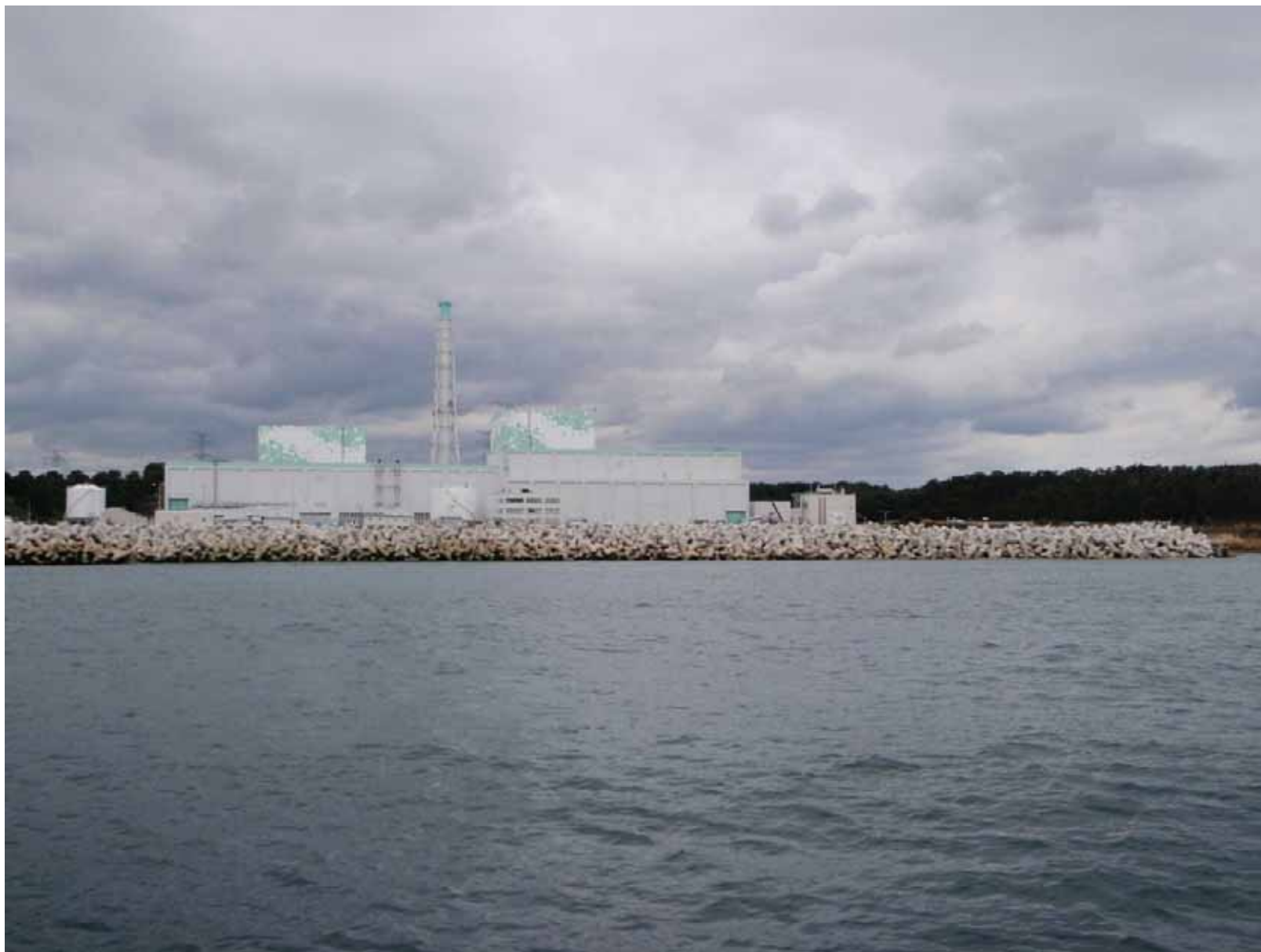
5・6号機防波堤（完成） 平成23年10月5日