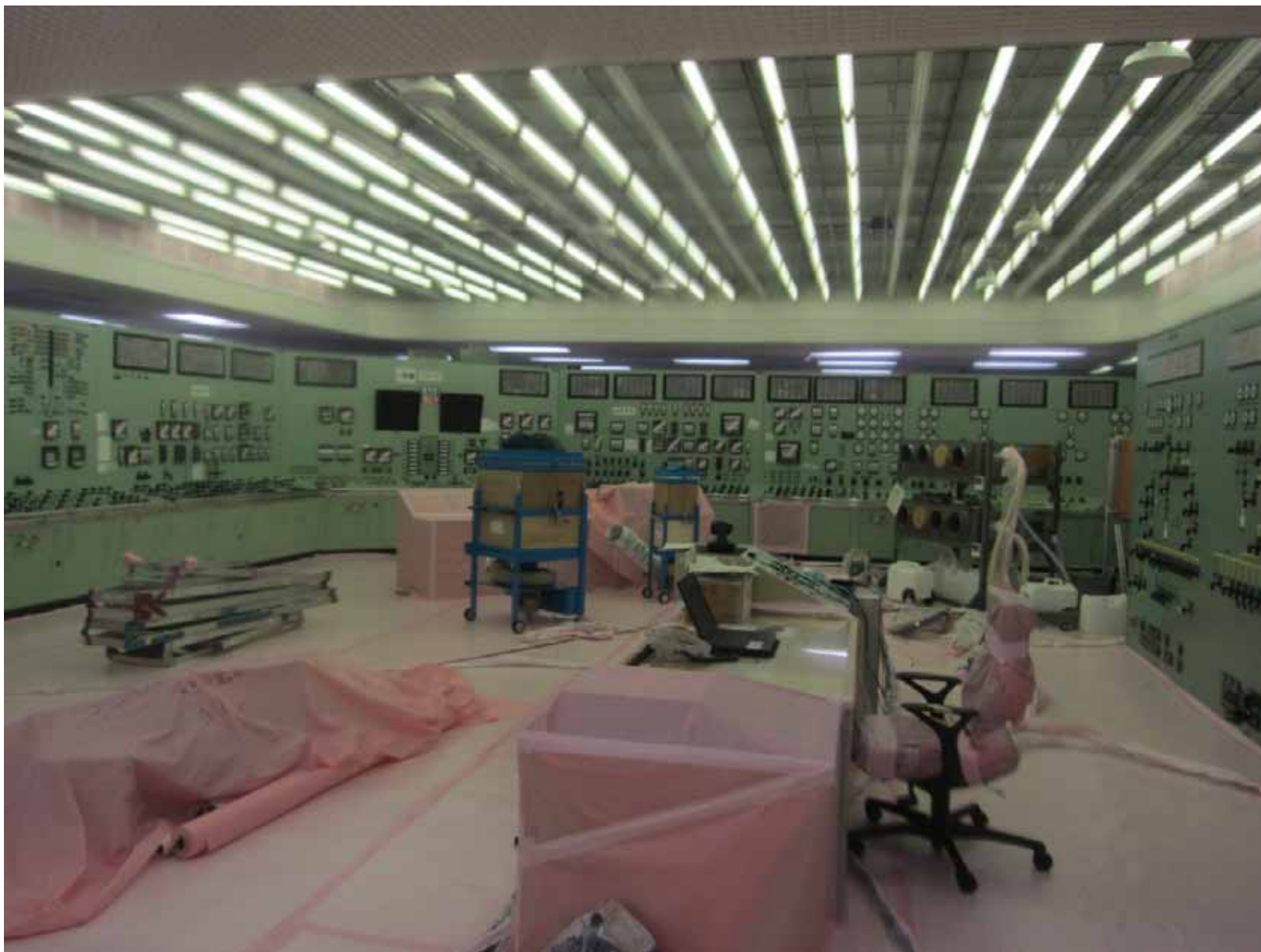
1・2号機中央制御室 平成23年9月22日 当社社員撮影