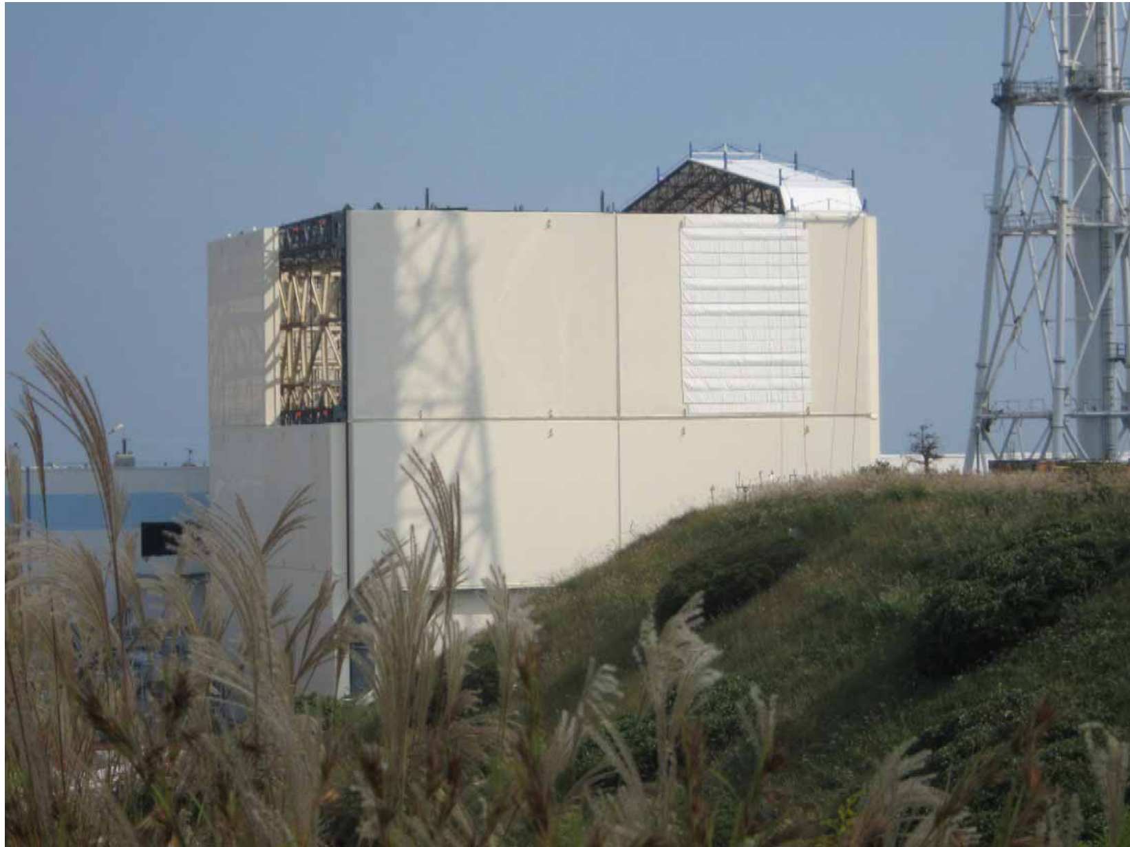
1号機原子炉建屋外観 ～免震重要棟南側から撮影～ 平成23年10月8日