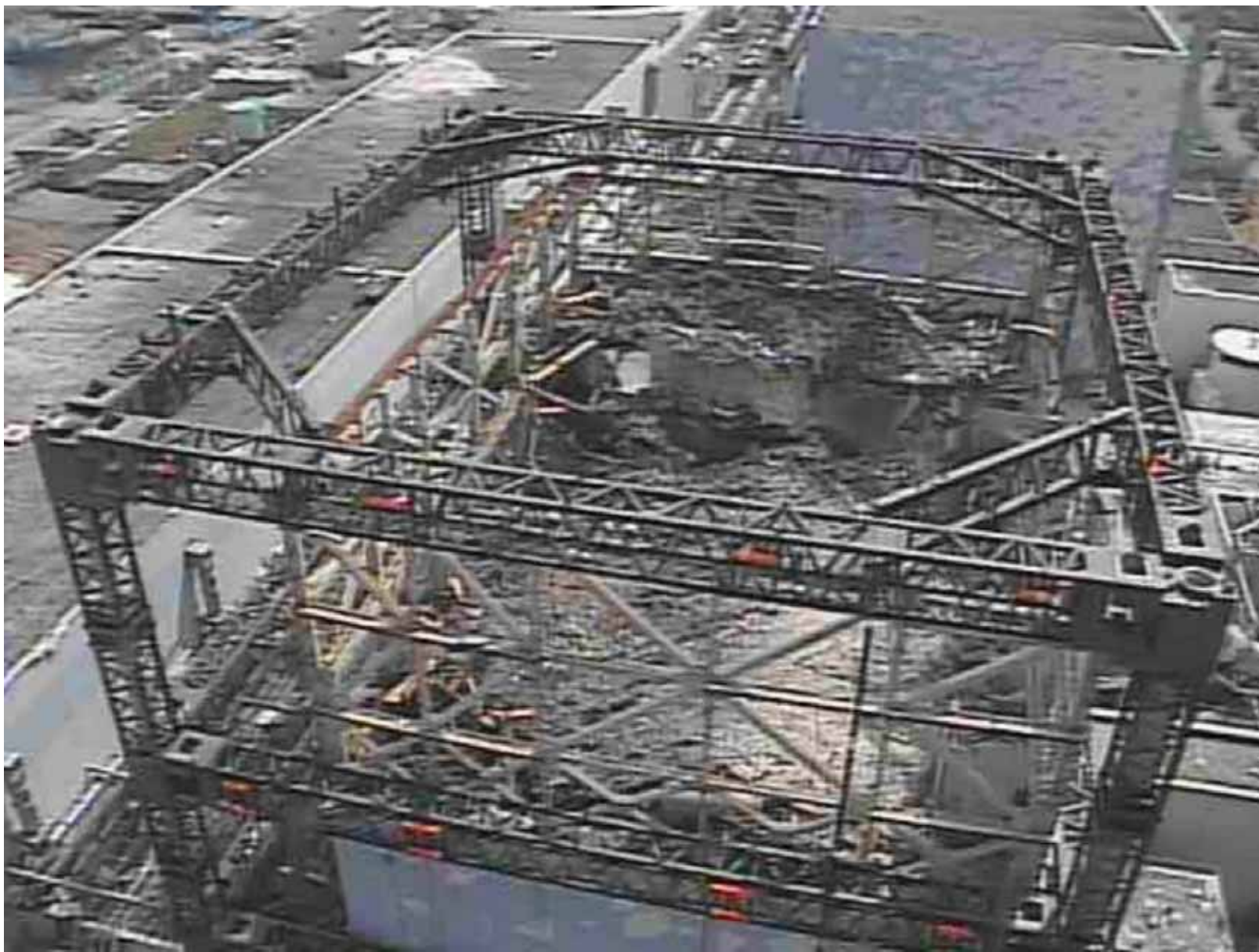
1号機原子炉建屋外観 ~上空クレーンから撮影~ 平成23年9月9日