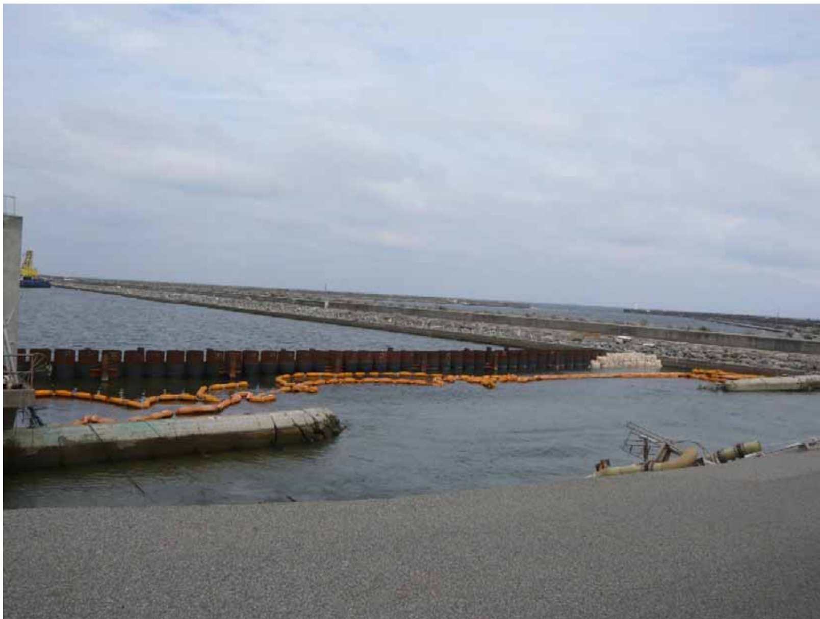
鋼管矢板 ~ 1号機 - 4号機取水口 ~ 平成23年 9月28日