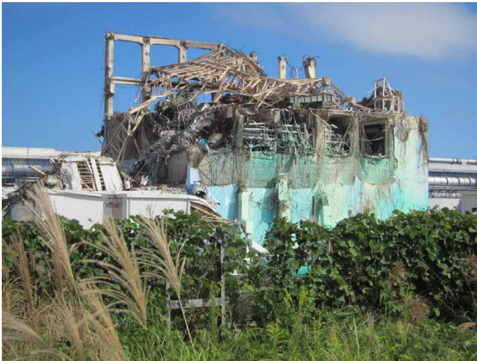
3号機原子炉建屋外観 ～ 2・3号機間西側高台から撮影～ 平成23年9月29日