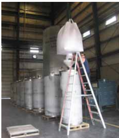
ベッセルへのゼオライト充填