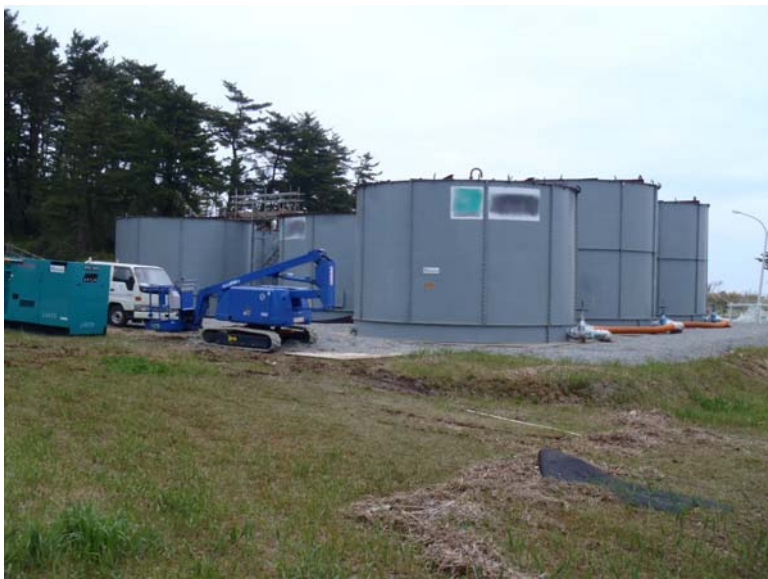
撮影日:平成23年5月11日10:30頃 場所:貯蔵所(北側) ②丸型タンク(配置図参照)