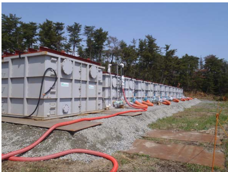
撮影日:平成23年5月4日9:30頃 場所:貯蔵所(北側) ①角型タンク(配置図参照)