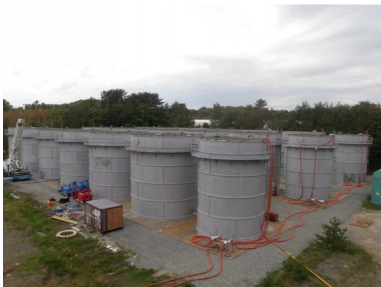
撮影:東京電力株式会社 撮影日:平成23年5月27日15:00頃 場所:貯蔵所(北側) ③丸型タンク(配置図参照)