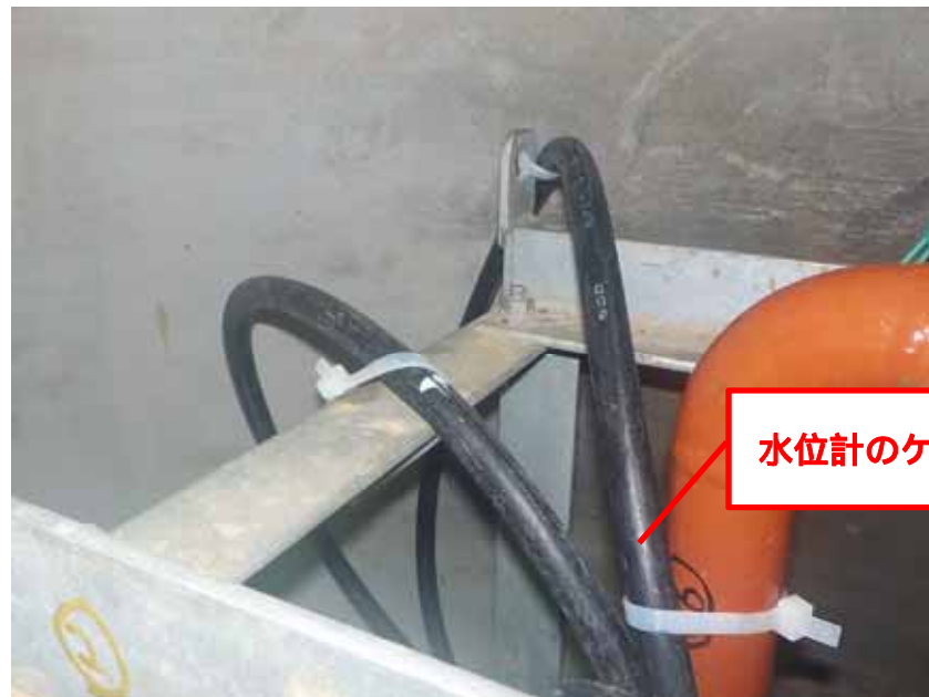
水位計のケーブル