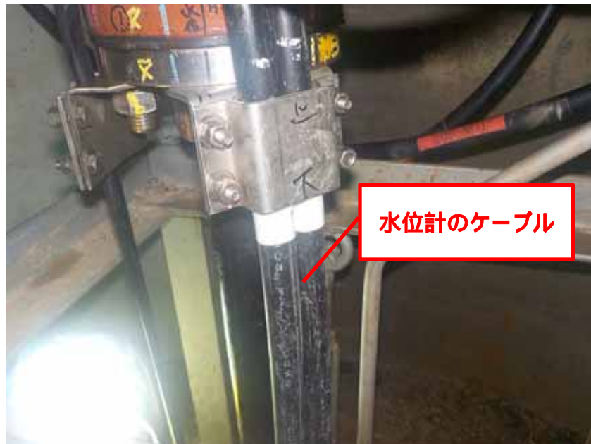
水位計のケーブル