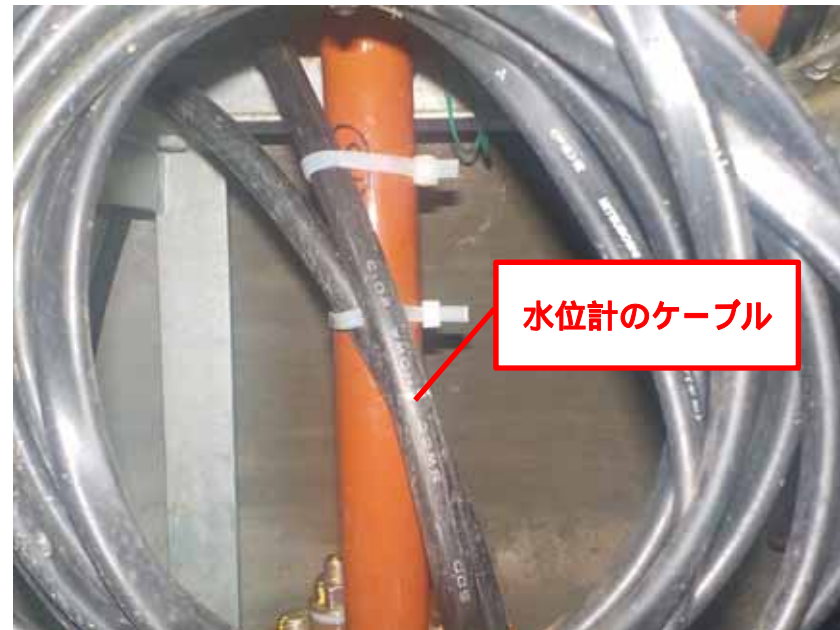
水位計のケーブル