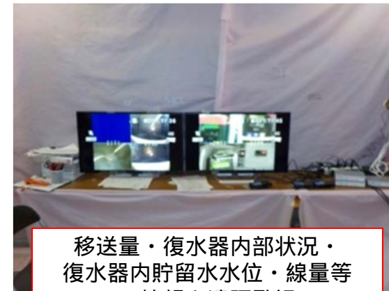
移送量・復水器内部状況・ 復水器内貯留水水位・線量等 の情報を遠隔監視