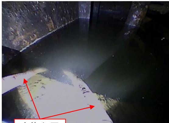
水抜き用のホース