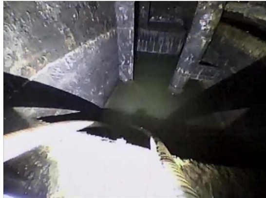
復水器H/W天板下部の水抜き作業 (移送中)