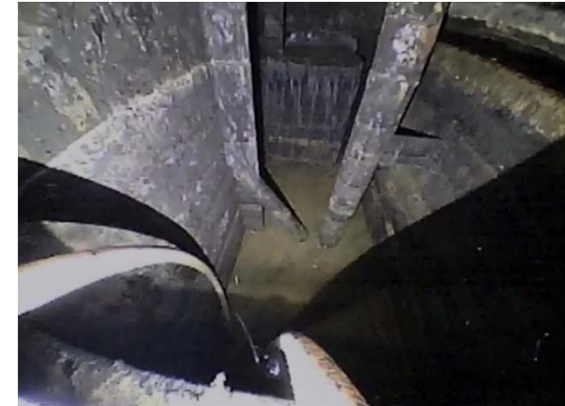
復水器H/W天板下部の水抜き作業 (移送後)