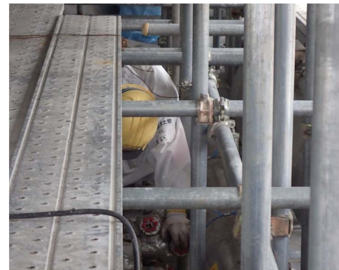
凍結管バルブ開作業