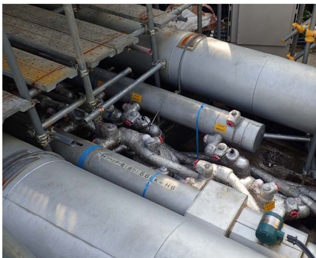
凍結管・バルブの状況