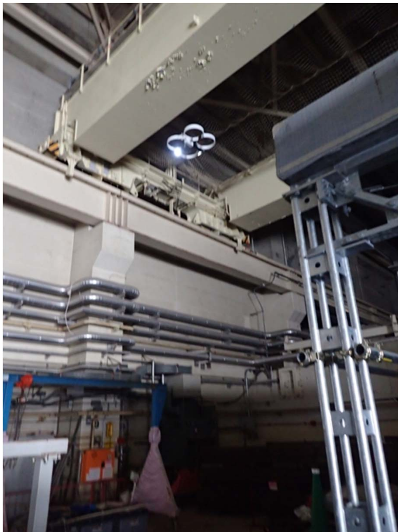
タービン建屋2階オペフロの飛行風景 (オペフロの南側から北側に向かって)