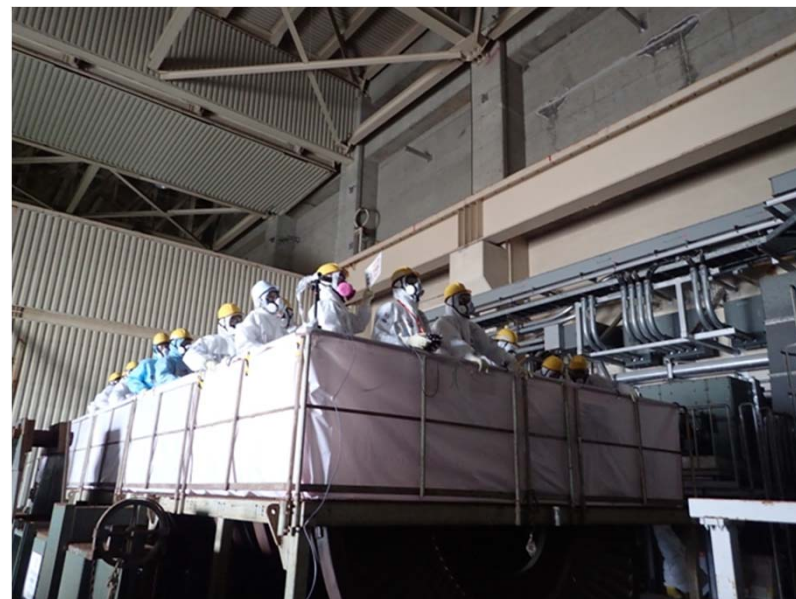
操作風景 (真ん中がオペレーター)