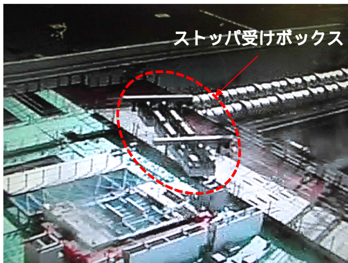
ストッパ受けボックス 吊り上げ中