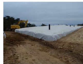
伐採木一時保管槽 (枝葉)