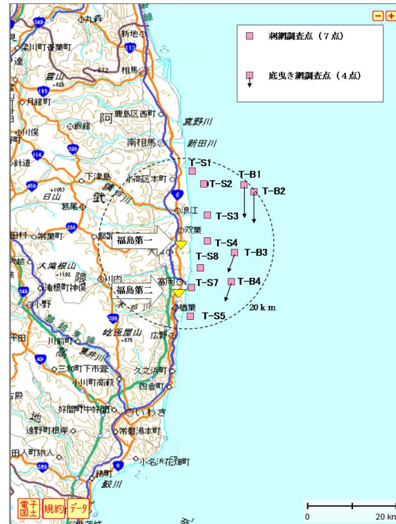
図3. 魚介類調査位置(2015年12月)

○ 当面、採取点を11地点とし、各月1回魚介類採取・測定を継続（天候等により採取できない場合あり）