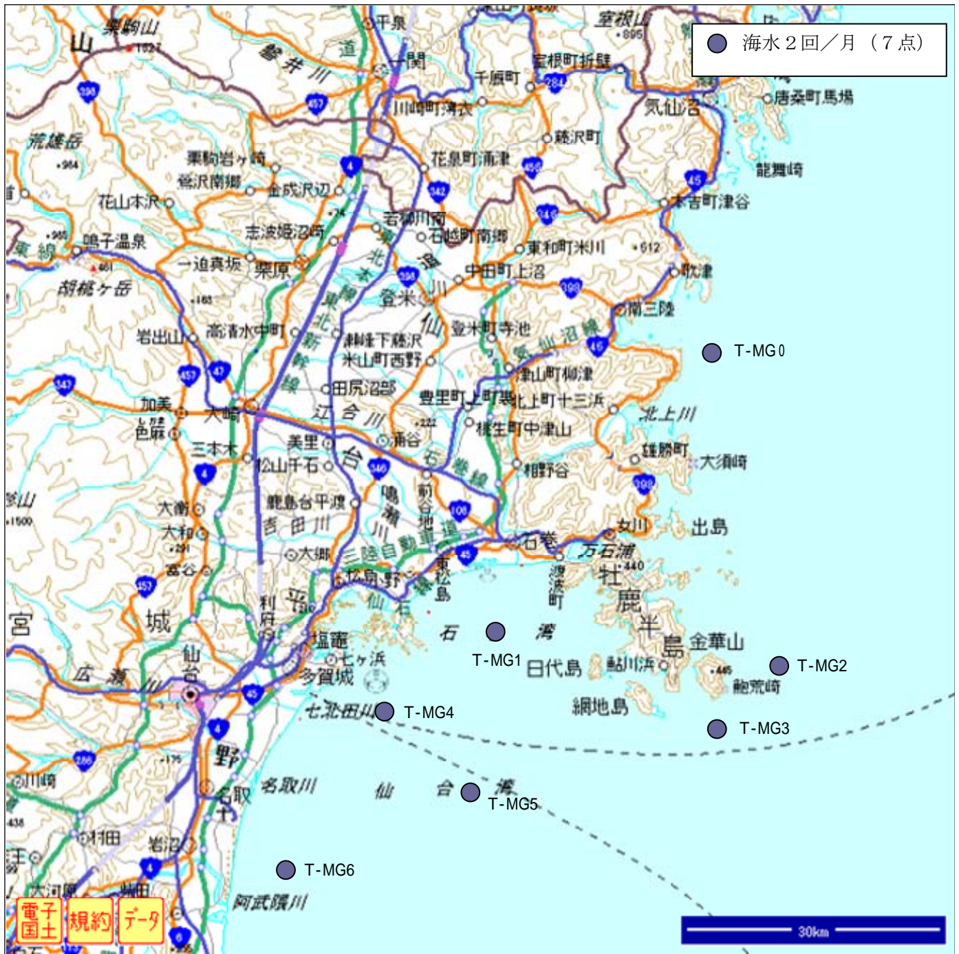
図3. 海水等サンプリング位置 (宮城県沿岸、H27年4月)