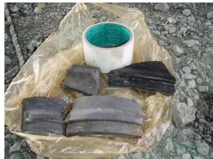
現場に落ちていた破片〔2015年3月30日撮影〕