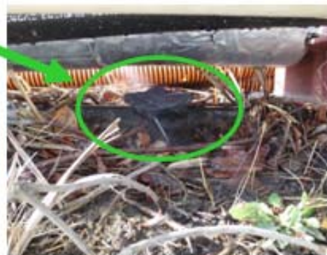
現場状況（北西土手）