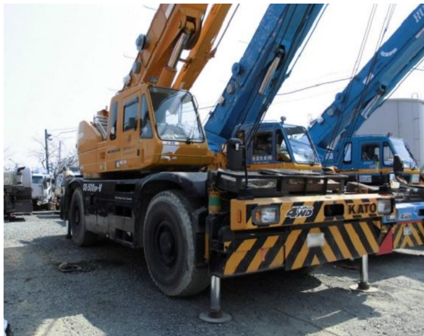
確認された50tホイールクレーン〔2015年3月30日撮影〕

その後の調査にて、パーキングブレーキの一部が破損している50tホイールクレーンを発見。火災現場に落ちていた破片は、当該クレーンのパーキングブレーキ破損部と形状がほぼ一致したことから、当該クレーンのものと判断。