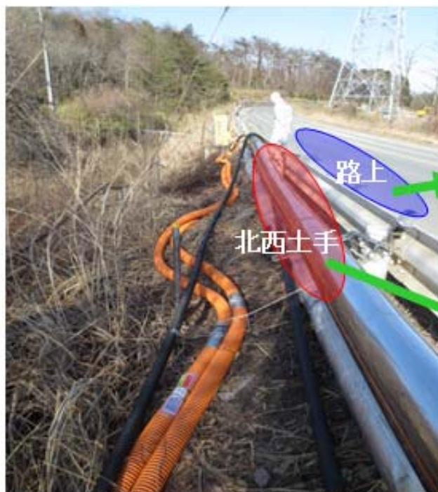
延焼の現場状況(道路北西側)

火災発生当日、現場確認の結果、車両の一部が道路および延焼範囲に落ちており、火災発生の原因となったと思われることから、後日周辺道路を走行したと思われる車両の調査を行った。【お知らせ済み】