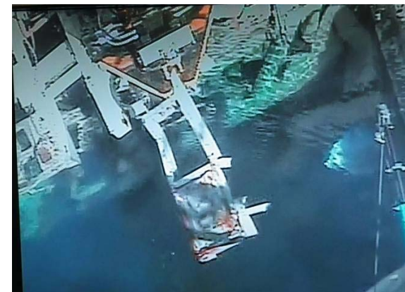
気中に吊り上げた様子