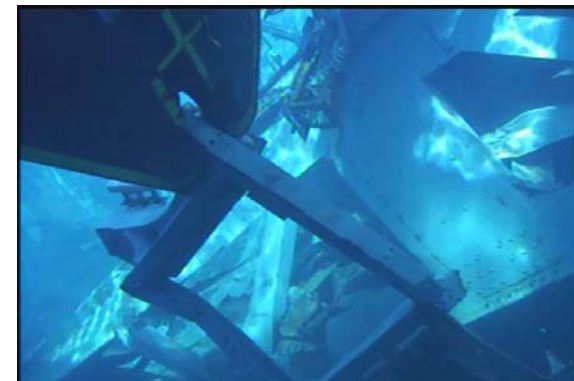
水中で掴んだ様子