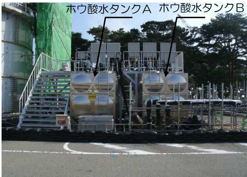
現状のホウ酸水タンク