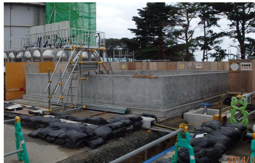
新設した堰（堰内にホウ酸水タンクを移設予定）