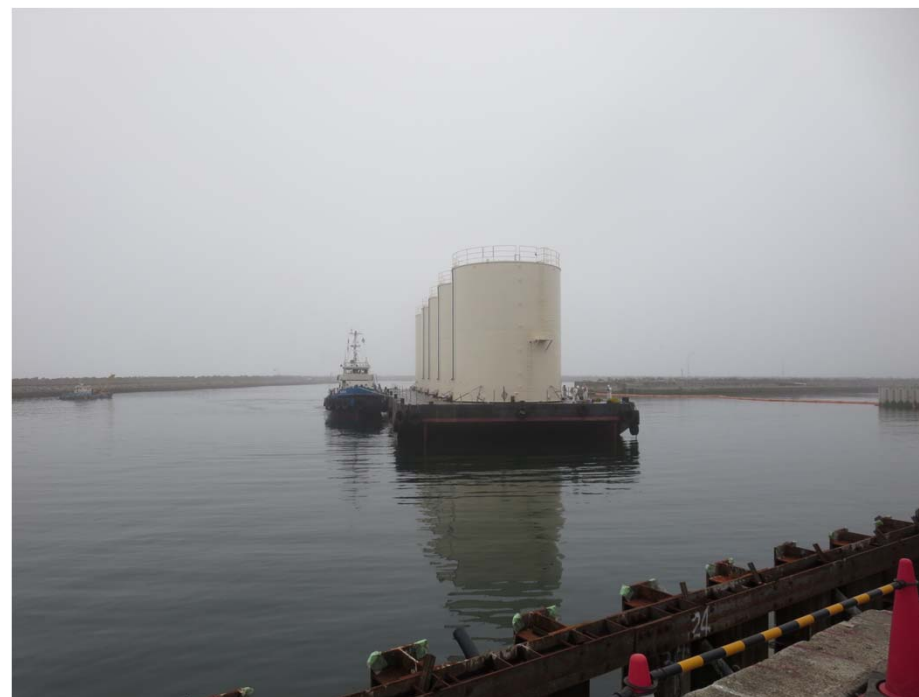
台船による海上輸送