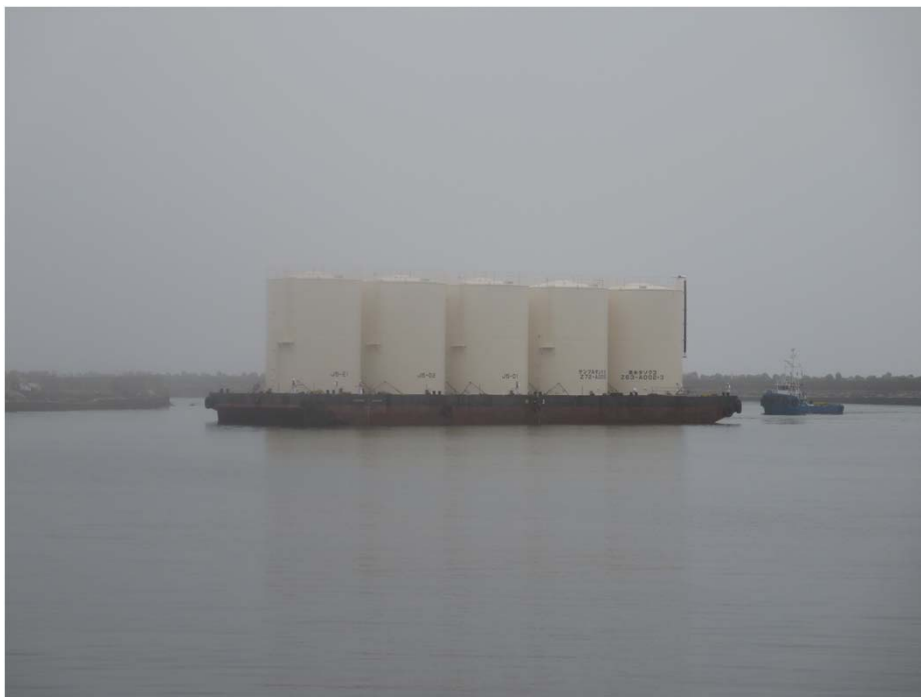
台船による海上輸送