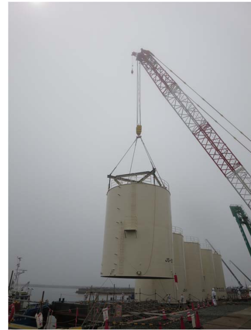
物揚場水切り (1基目)