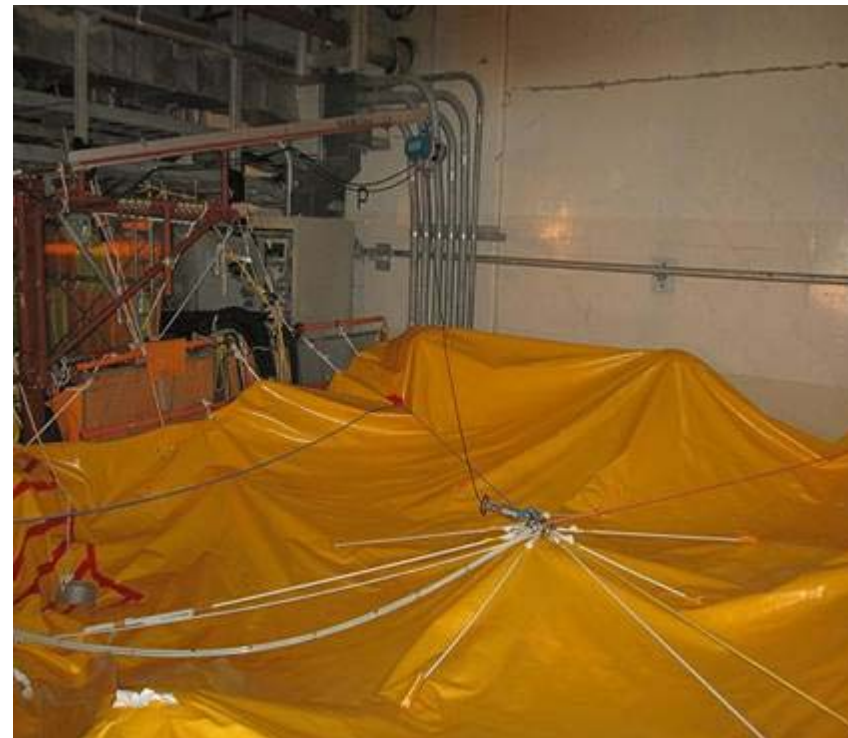
原子炉建屋3階開口部